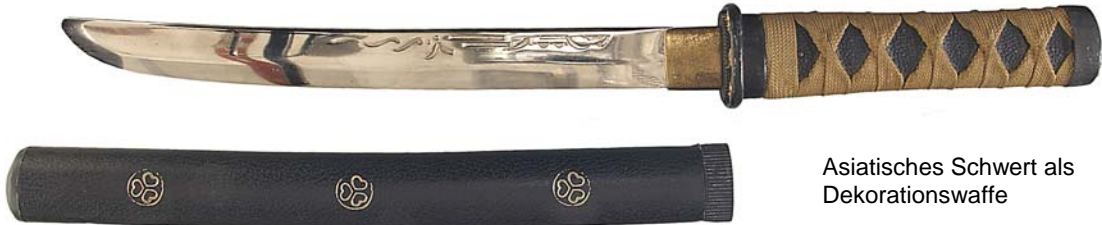
Asiatisches Schwert als Dekorationswaffe

Keine Hieb- und Stoßwaffen sind in der Regel solche Geräte, die zwar Hieb- und Stoßwaffen (§ 1 Abs. 2 Nr. 2 Buchstabe a WaffG i.V.m. Anlage 1 Abschnitt 1 Unterabschnitt 2 Nr. 1.1 zum WaffG) nachgebildet, aber wegen abgestumpfter Spitzen und stumpfer Schneiden offensichtlich nur für den Sport (z.B. Sportflorete, Sportdegen, hingegen nicht geschliffene Mensurschläger), zur Brauchtumpflegerie (z. B. historisch nachgebildete Degen, Lanzen) oder als Dekorationsgegenstand (z. B. Zierdegen, Dekorationsmesser) geeignet sind.