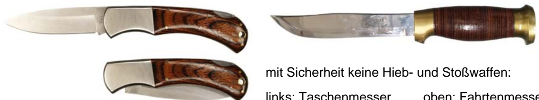
mit Sicherheit keine Hieb- und Stoßwaffen:

Die als Jagdnicker bezeichneten feststehenden Messer mit einseitig geschliffener Klinge und typischer Griffform (oft mit Horngriffen) stellen heute übliche Schneidwerkzeuge zum Aufschärfen 4 und Abhäuten von Wild dar und sind demnach nicht dazu bestimmt, die Angriffs- oder Abwehrfähigkeit von Menschen herabzusetzen. Diese Beurteilung gilt auch für Hirschfänger, die in der heutigen Zeit allenfalls noch als Bestandteil einer Jagd- oder Forstuniform (Zierrat) Verwendung finden.